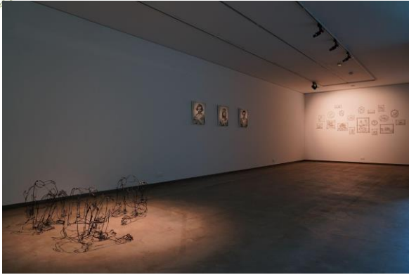
(左)徐均育二樓展間作品