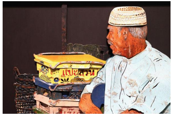
(右)庫索菲亞·尼布耶莎_在耶拉的祖父_局部

羅懿君本次展出的《海之味》系列作品，用風乾或曬乾後的香蕉皮，紀錄外籍移工在台的生活群像及心境滋味。藝術家透過每一次交談、繪製一幅速寫，再以香蕉皮似墨非墨的粗曠輪廓，拼湊出一個個飄洋過海而來的故事。烏達邦·寧曼萊考 (Uttaporn Nimmalaikaw) 的大型繪畫裝置，主題來自於家族成員，繪於層層蚊帳、薄紗上的臉孔與身軀時而飄動游移，藉此呈現身心狀態的凋零與紊亂，混沌陰鬱的氛圍亦映照出當今社會帶給人心的不安。