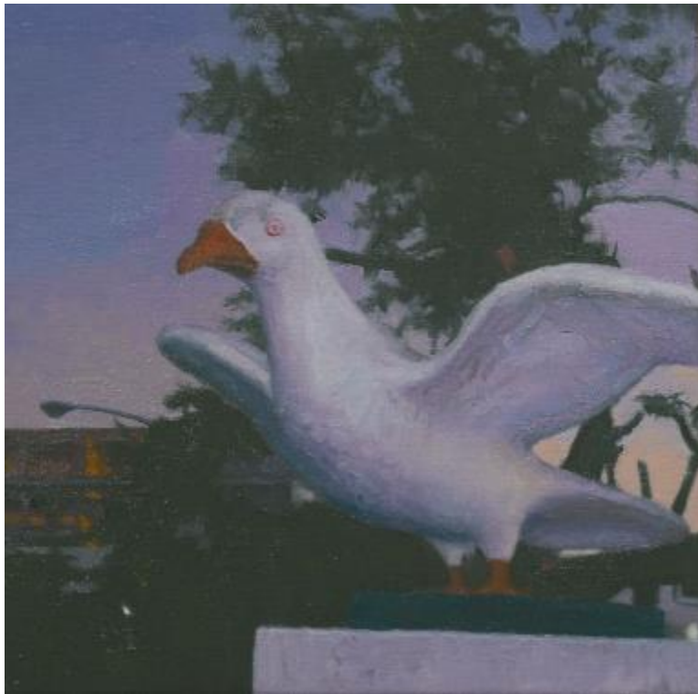
林彥瑋/公園的鴿子/ 30 x 30 cm/油彩、畫布/2020