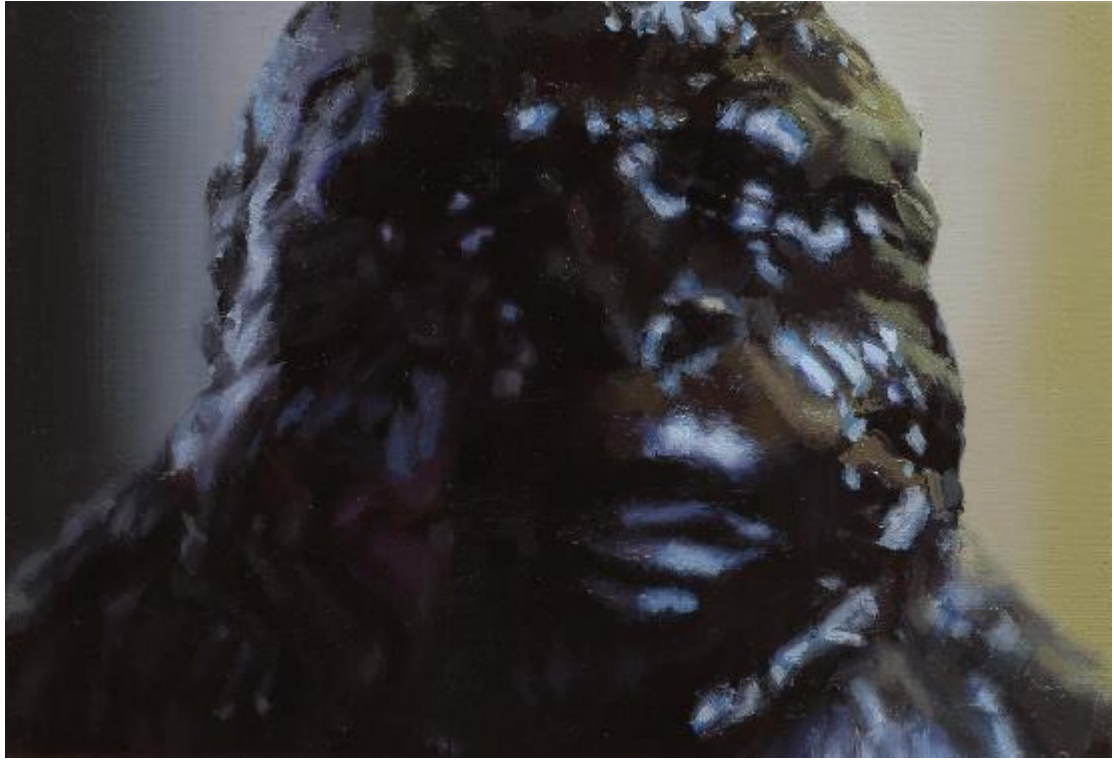
林彥瑋/玩物參照 24/ 24 x 35 cm/油彩、畫布/2021