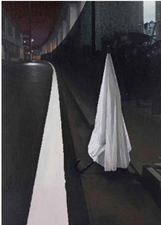
廖震平/雨傘與標線/ 91 x 72.5 cm/油彩、麻布/2021