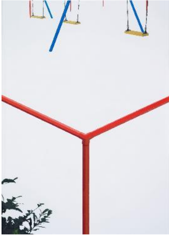
廖震平/雪地裡的紅線/ 91 x 65.2 cm/油彩、水性樹脂顏料、麻布/2016