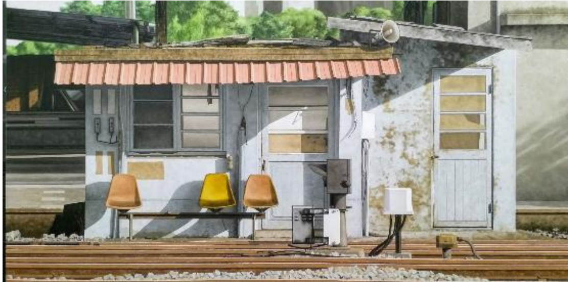
蔡孟閻/都會沒有鐵路-12：嘉義/ 97x 194 cm/油彩、畫布/2021