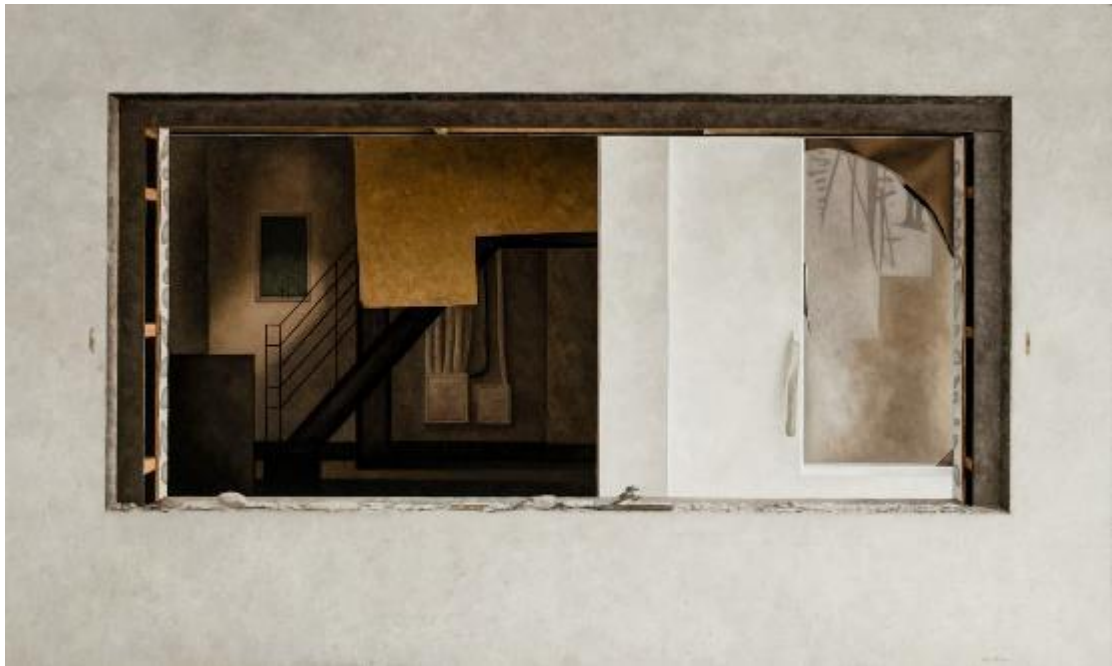
蔡孟閻/都會沒有鐵路-10：嘉義鐵道藝術村/ 97x 162 cm/油彩、畫布/2021