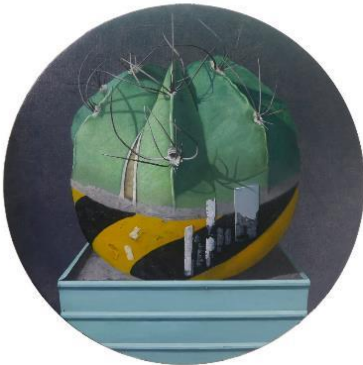
高冠羣/新樂園系列-過程/ 80x 80 cm/油彩、畫布/2020