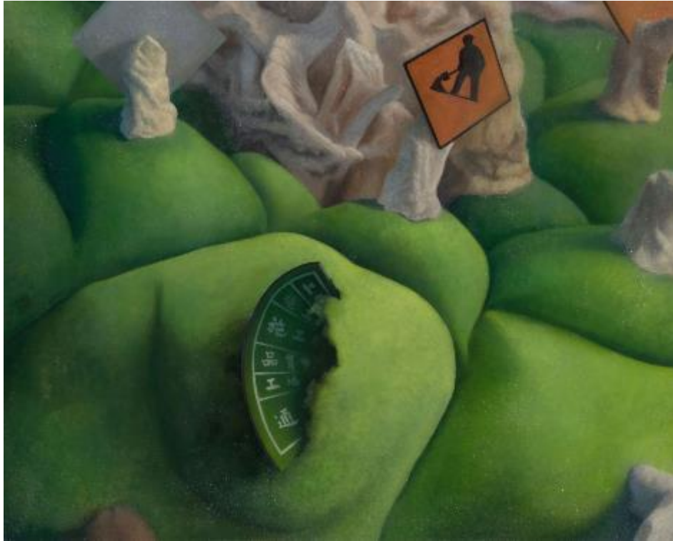
高冠羣/新樂園系列-草原上/ 72.5x 91 cm/油彩、畫布/2017